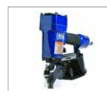
Nailer and Nails Cloueuses et Clous